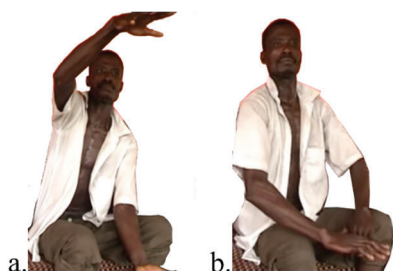
Figura 14 – Fragmentos dos dois únicos momentos em que o gestuante olha para a câmara, um para marcar o tamanho do saco com os caracóis (a) e o outro no final, quando produz o último gesto, COBRIR (b).

Esta análise de duas narrativas em AdaSL que envolvem encontros de surdos com cobras revela que ambas estão bem estruturadas internamente e fazem uso abundante da incorporação. A direção do olhar, representações de tamanho e forma e classificadores são também utilizados pelos surdos, mas não são relatados neste artigo.