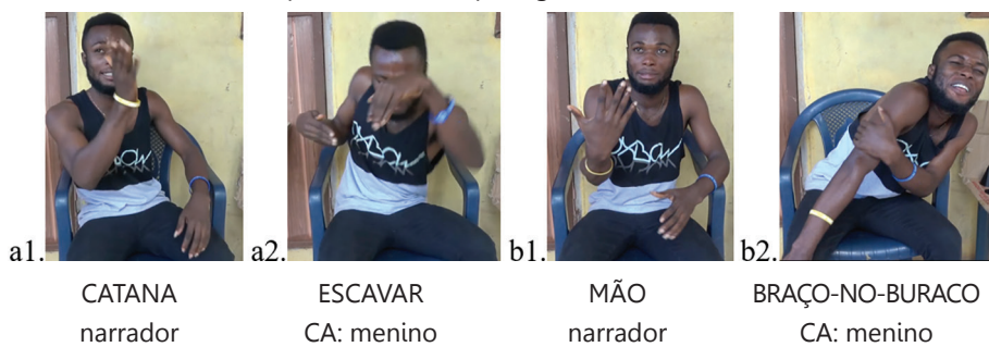
Figura 6 – Fragmento desenrolar da ação, em que o surdo indica à câmara o que será usado na ação (a1 e b1) antes de personificar o rapaz agindo (a2 e b2).

No desenvolvimento da ação, o jovem surdo descreve o conflito encarnando as diferentes personagens (o filho, o pai e a cobra), utilizando a incorporação. Explica que viu algo em movimento, vai ver o buraco no chão e coloca o seu braço lá dentro sem pensar no perigo. Ele tenta cavar o buraco para o tornar maior e volta a colocar o seu braço no buraco, sem ouvir nada. Nesta parte, o surdo olha para a câmara, atuando como narrador, pouco antes de encarnar uma personagem que, neste caso, é o rapaz. Como narrador, ele diz à câmara o que vai utilizar na ação que se segue, seja a catana ou a mão (Figuras 6a1 e 6b1), e depois encarna a personagem ou cavando o buraco com a catana ou colocando a mão no buraco (Figuras 6a2 e 6b2).