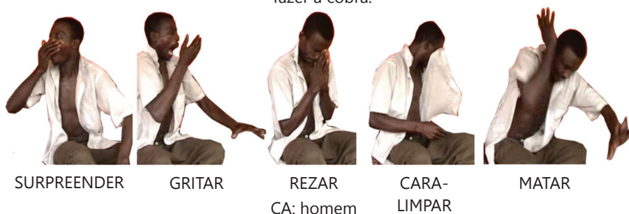
Figura 13 – Fragmento do clímax, em que o surdo encarna o homem a decidir o que fazer à cobra.

Fiquei surpreso e gritei (...) Eu rezei a Deus. (...) Preparei-me (...) matei-o.