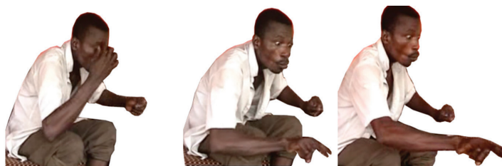
Figura 10 – Fragmento da introdução, em que o surdo encarna o caracol.