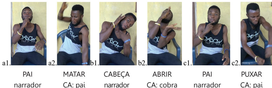
Figura 8 – Fragmento do clímax, em que o surdo indica à câmara quem está a ser encarnado, o pai (a1 e c1) e a (cabeça da) cobra (b1), antes de efetivamente encarnar o pai (a2 e c2) e a cobra (b2).

O meu pai cortou a cabeça da cobra com a catana. A cabeça da cobra abriu-se. (...) O meu pai puxou a cobra para fora do buraco.