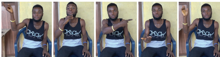
Figura 5 – Fragmento da introdução, em que o surdo, atuando como narrador, olha para a câmara.

Logo no início da Narrativa 1, o surdo diz quando teve a experiência ( há muito tempo atrás, quando eu era pequeno ), onde aconteceu ( lá no campo ) e quem são as personagens ( eu fui com o meu pai ). Quando ele atua como narrador, normalmente olha para a câmara (Figura 5).