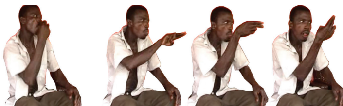
Figura 11 – Fragmento do desenrolar da ação, em que o surdo encarna a língua da cobra.

No desenvolvimento da ação, o gestuante explica o que estava a fazer antes de o conflito surgir: Estava a apanhar caracóis sozinho em todo o lado . Depois conta que viu uma cobra e descreve-a. Quando o conflito surge, ou seja, durante o clímax, a cobra torna-se uma ameaça e ele tem de lidar com ela, primeiro rezando e depois matando-a. Aqui, o surdo interpreta as duas personagens, o homem (ele próprio) e a cobra. Ele personifica a cobra duas vezes (Figuras 11 e 12). Na primeira vez, ele aponta para a língua e usa a configuração U (☞) para representar a língua da cobra (Figura 11). A cabeça inclina-se para a frente, o pescoço e a língua movem-se simultaneamente com a mão agindo como a língua da cobra.