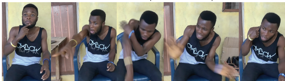
Figura 9 – Fragmento da resolução da ação, em que o gestuante nomeia o pai para a câmara antes de o encarnar dando uma reprimenda ao filho por meio de mímica.

PAI narrador TU CA: pai BURACO NÃO OUVIR