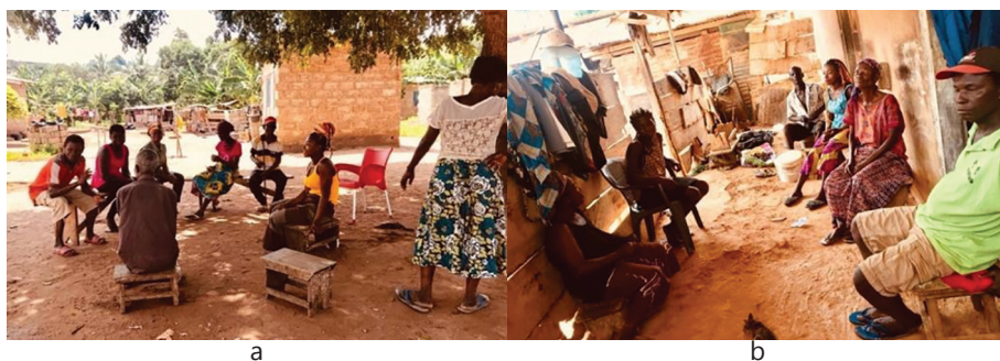
Figura 3 – Grupos de aldeões surdos reunidos nos seus lugares habituais, debaixo da árvore (a), ou dentro do complexo habitacional (b).