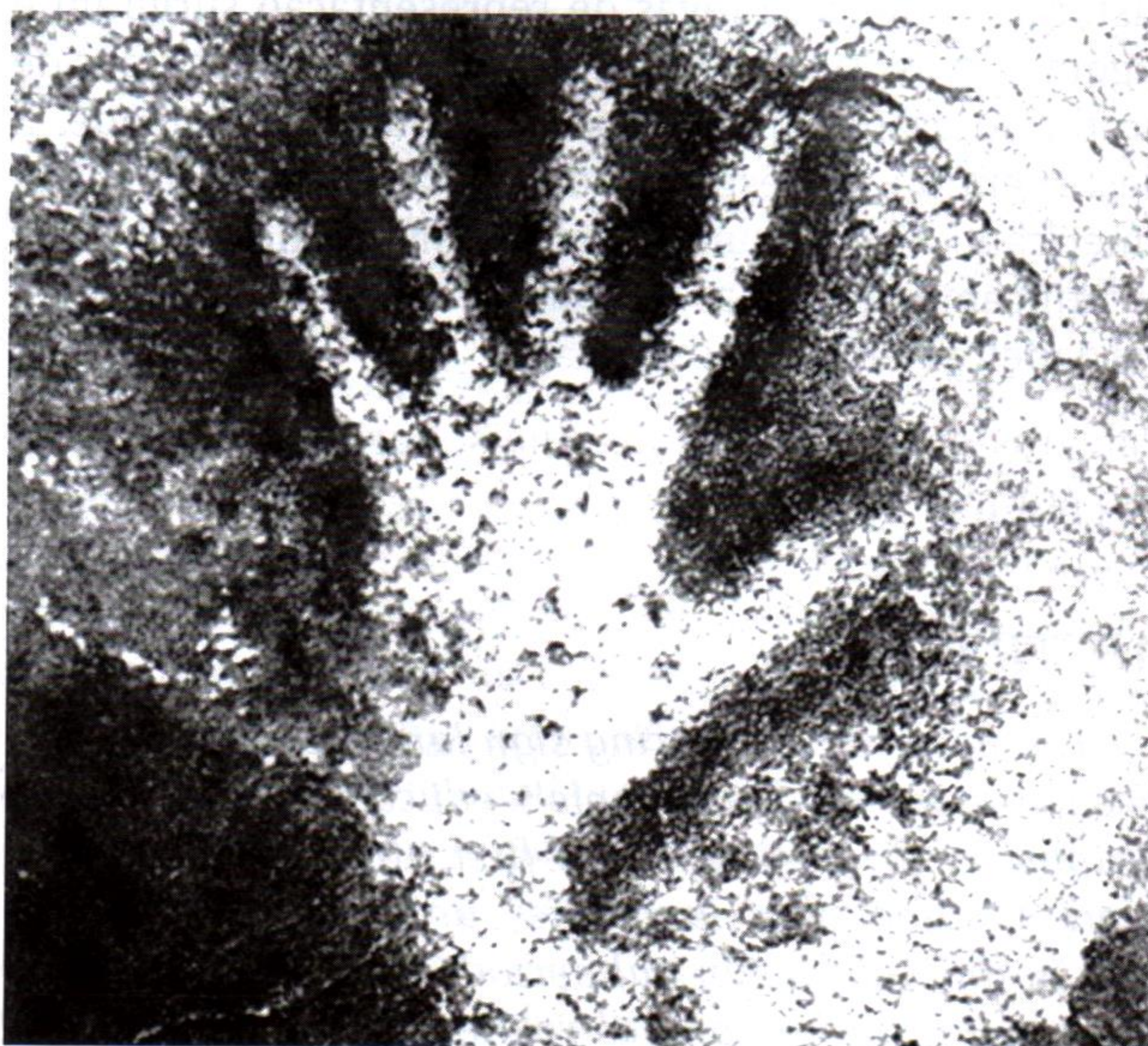
Figura 1. Mão esquerda (OLIVEIRA, 1992)

Essas formas de registro (Figura 1) existem principalmente em cavernas ao sul da França e ao norte da