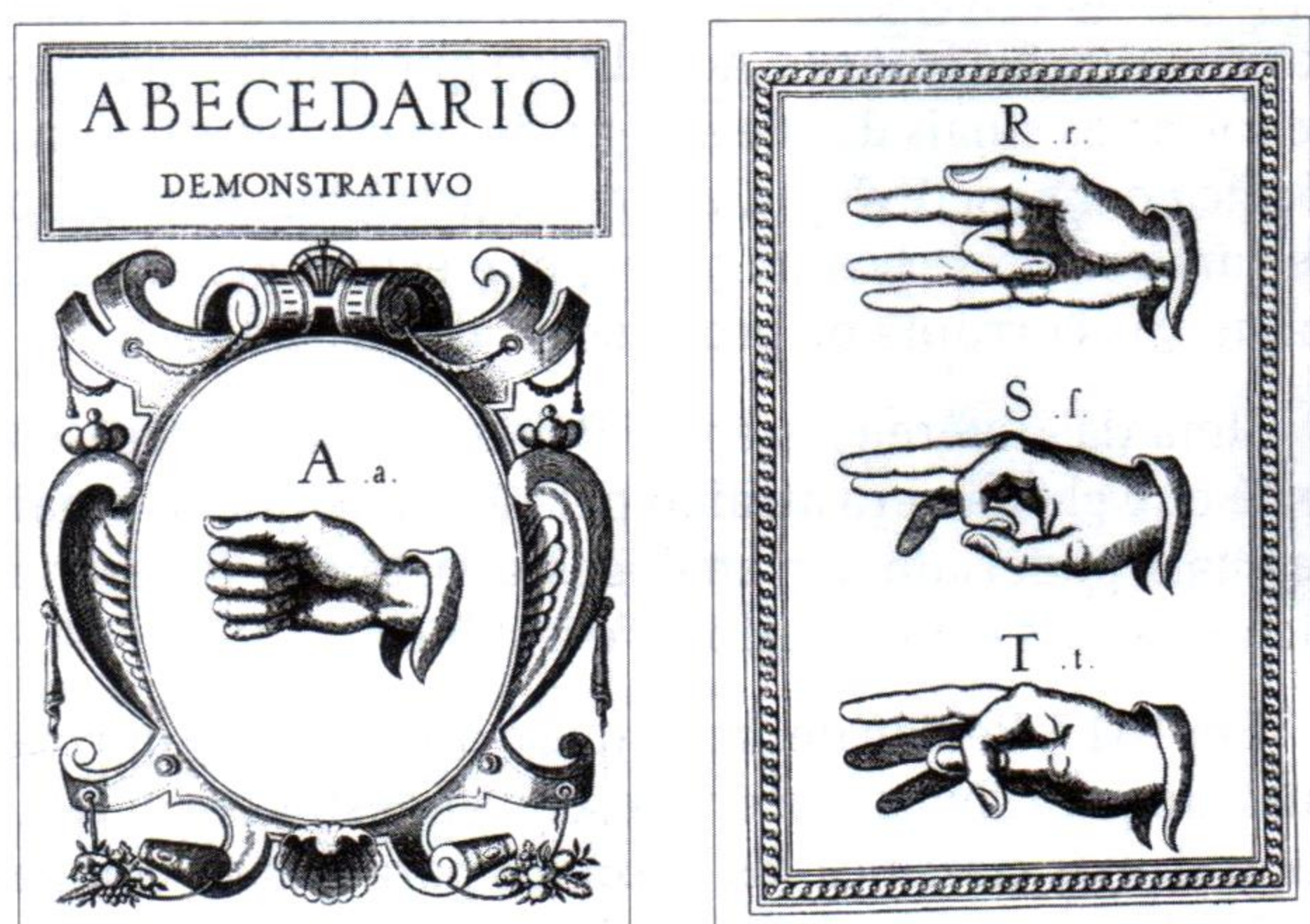
Figura 2. Finger Alphabet, (RÉE,1999)

método de comunicação adotado por várias comunidades religiosas da época. A arte consistia em valer-se de diferentes configurações da mão para representar qualquer letra do alfabeto. Bonet acreditava que o treinamento do surdo deveria ser iniciado pelo uso do alfabeto unimanual (Figura 2):