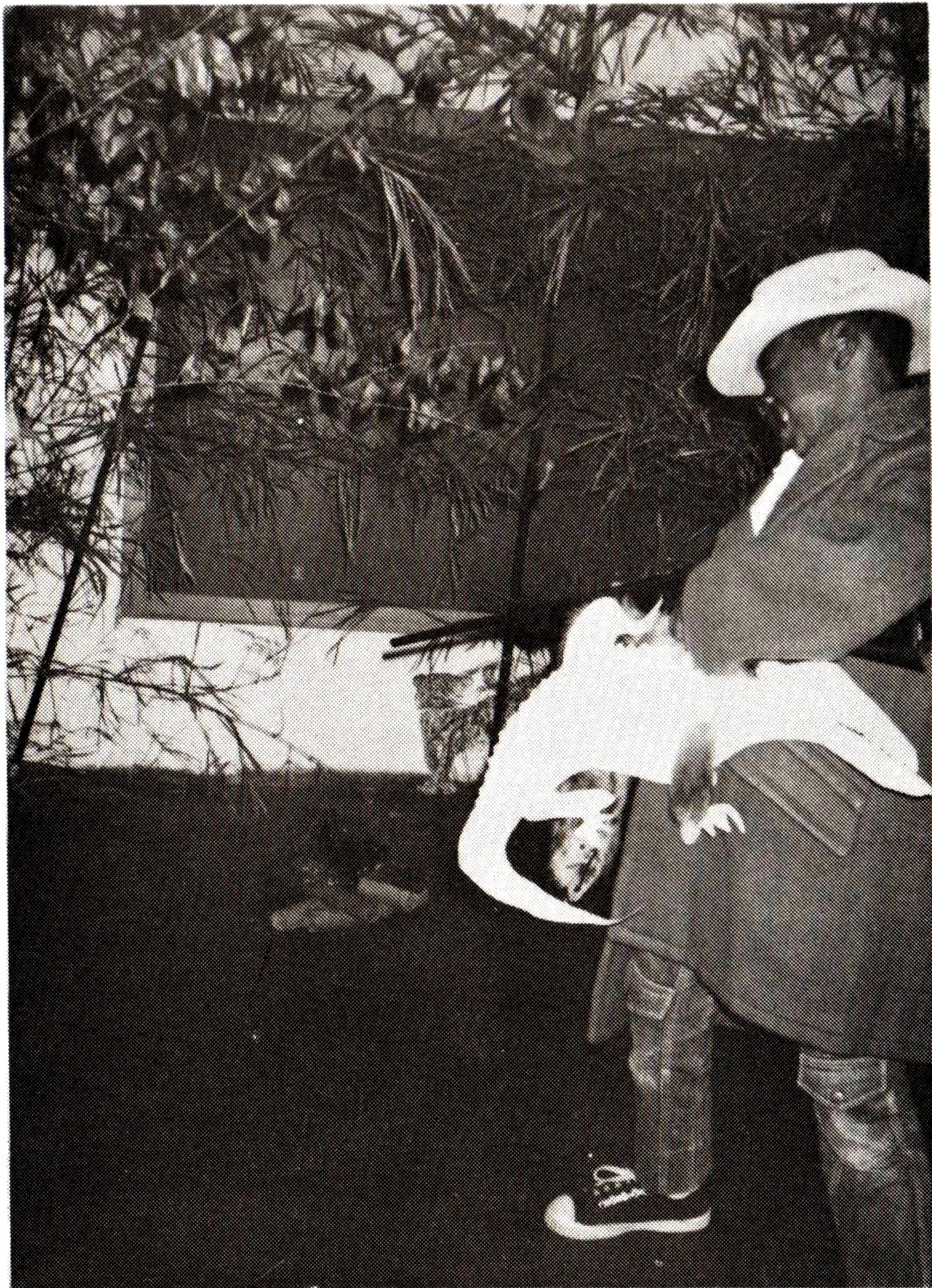
5. O caçador ambicioso quer matar os animais para tirar o pelo e o couro para vender caro.