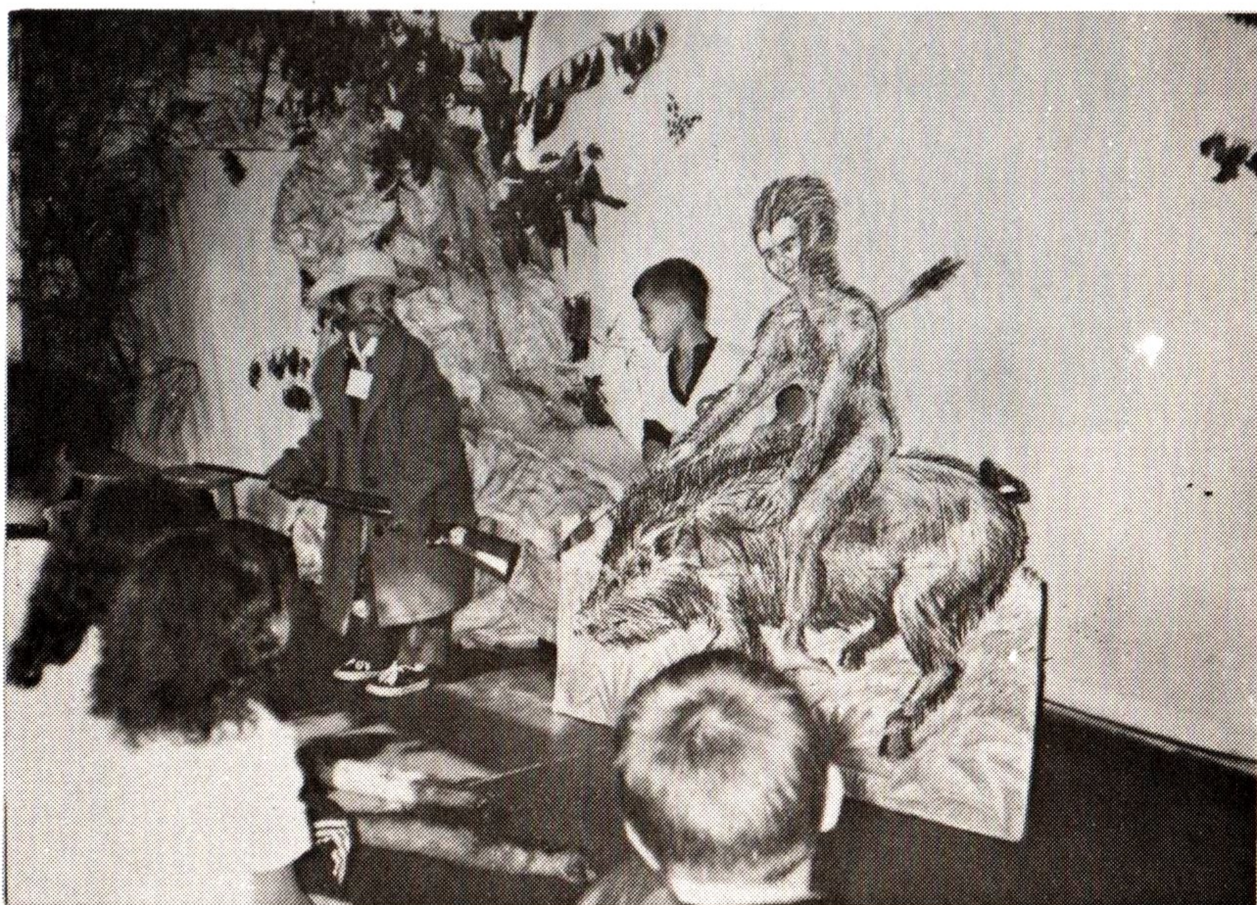
7. Surge, então, o Curupira para assustar o caçador e expulsá-lo da mata.

O Curupira protege os animais da mata. Ele é amigo dos índios.