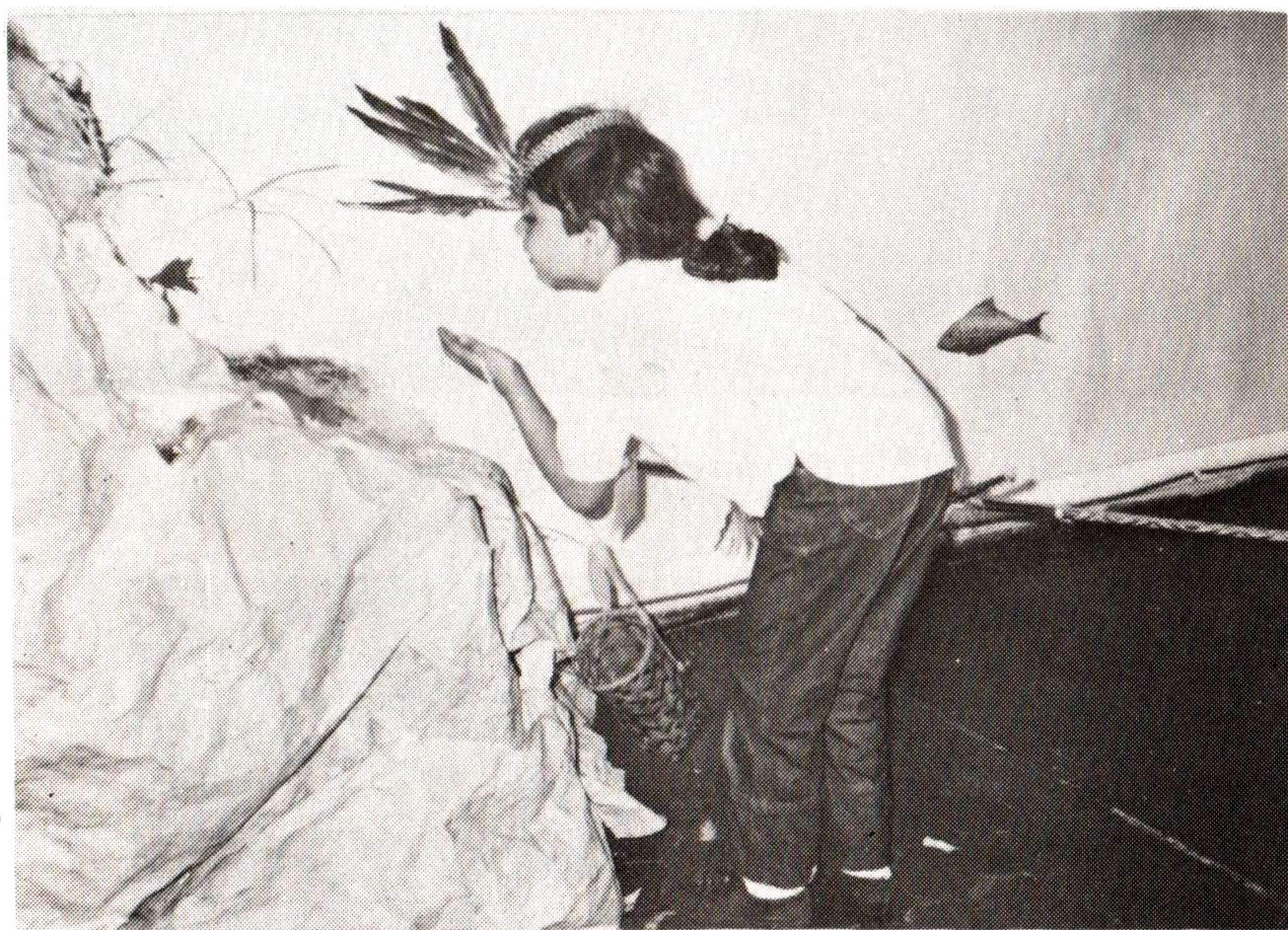
1. O índio, amigo da natureza, alimenta-se dela.