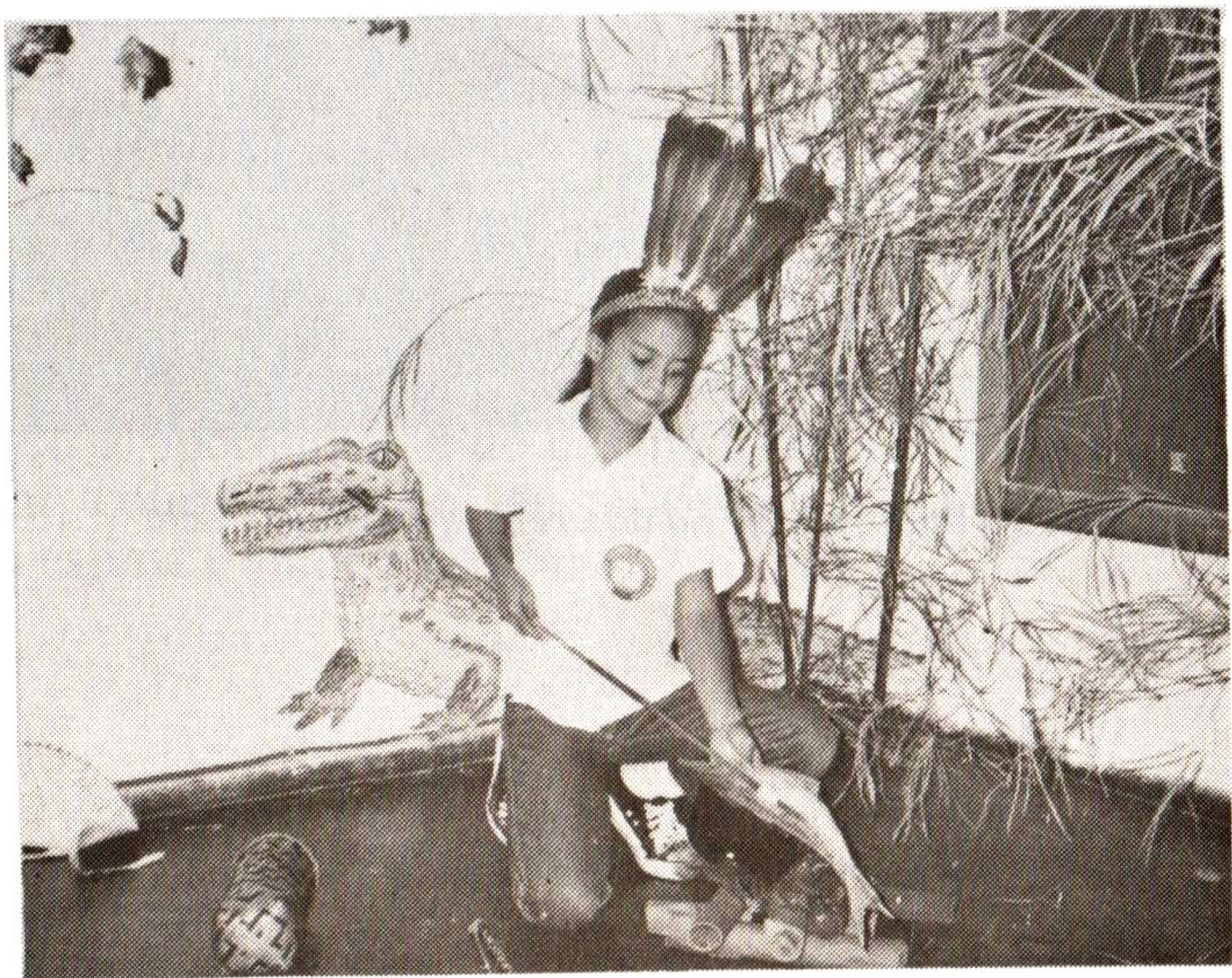
3. O índio vive na mata. Ele pesca e faz o fogo para assar o peixe.