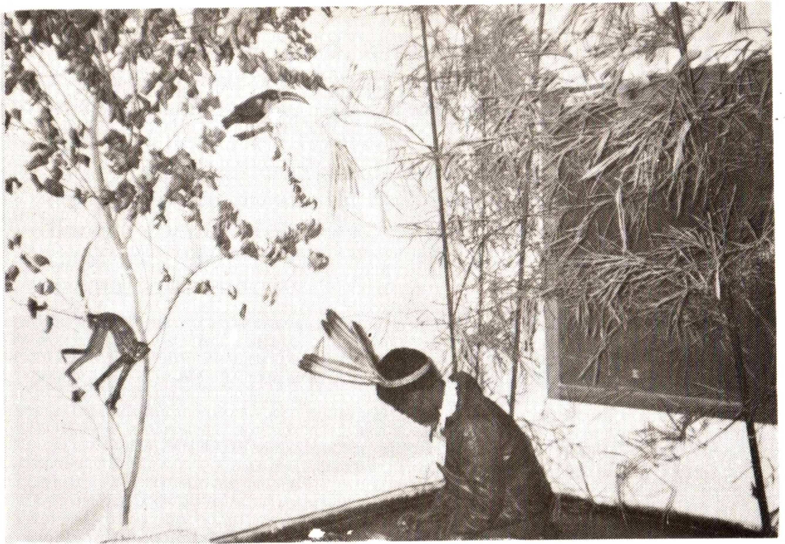
2. O índio caça para comer.