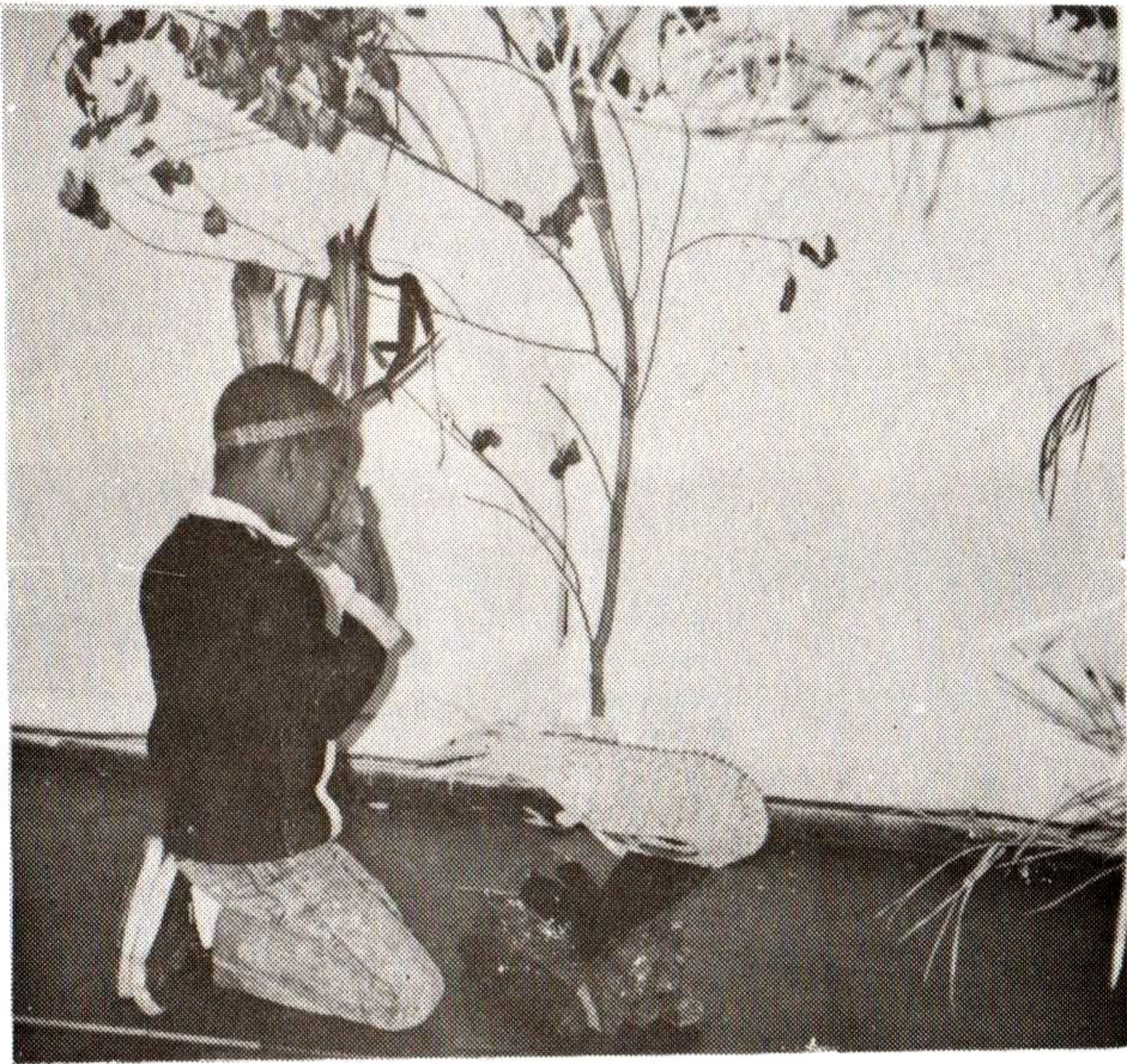
4. O índio conhece os animais e convive com eles.