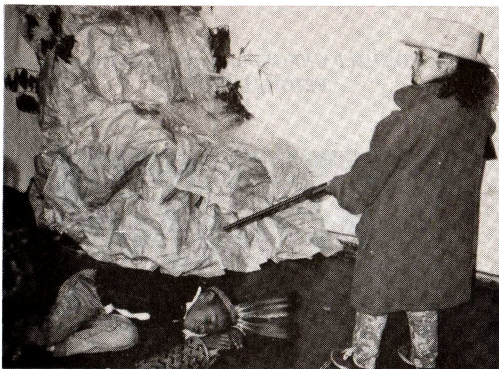
6. Às vezes, mata o índio para tomar-lhe a terra.