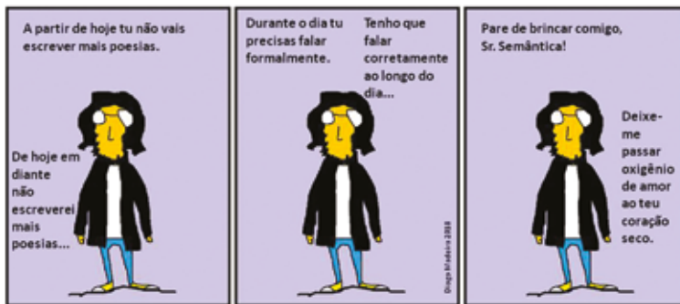
Sr. Semântica, Tirinhas “Vagões poéticos”