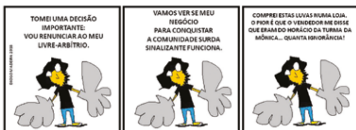
Polêmica luvas da Série “Olhares Surdos ignorados por Aristóteles”