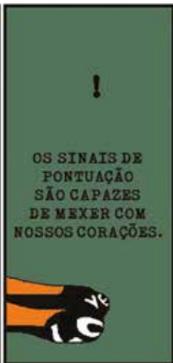
Sinais de Pontuação, Tirinhas "Vagões poéticos"