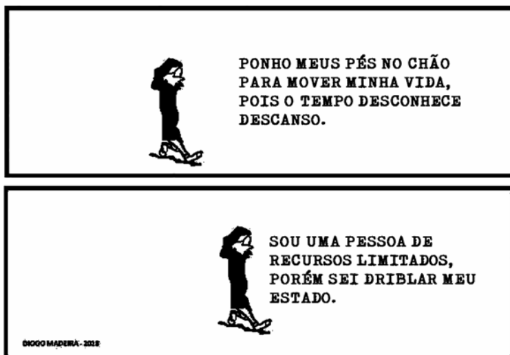
Sei driblar o meu estado, Tirinhas “Vagões poéticos”