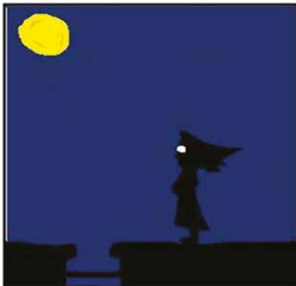
A lua, Tirinhas "Poeta Z" (sem texto)