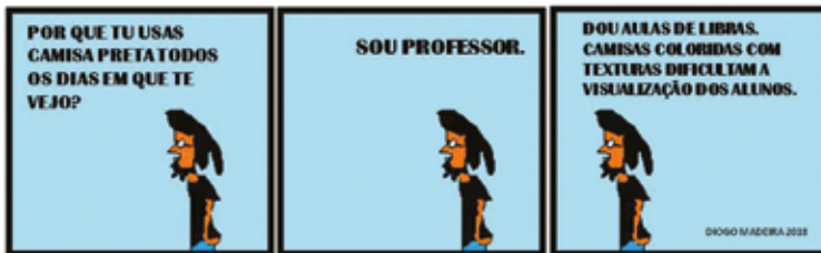
Camiseta preta, Tirinhas "Olhares Surdos Ignorados por Aristóteles"