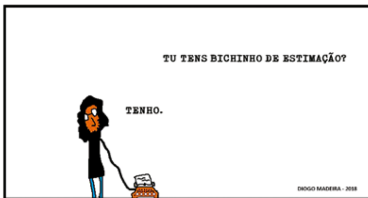
Tens bichinho de estimação, Tirinhas "Vagões poéticos"