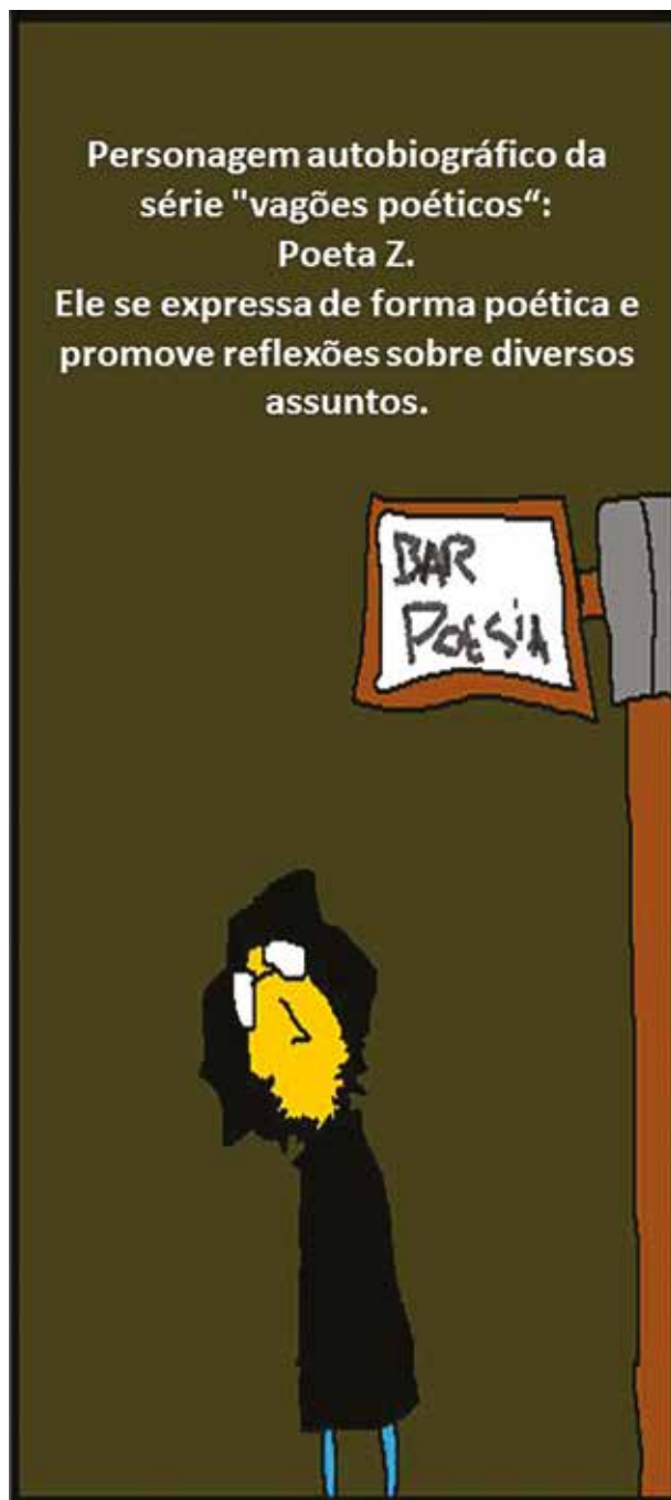
Personagem autobiográfico, poeta Z, da série "Vagões poéticos"