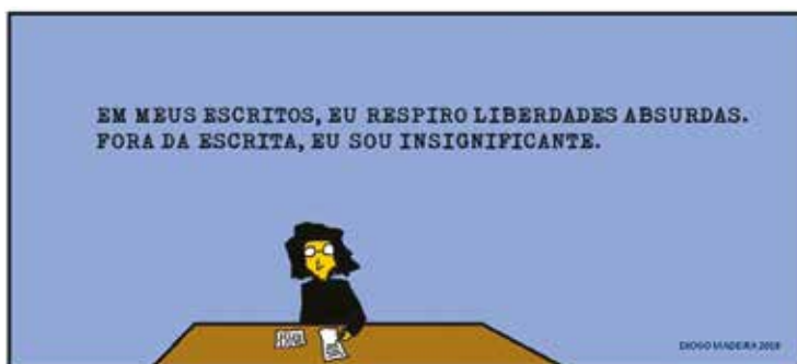
Meus escritos, Tirinhas "Vagões poéticos"