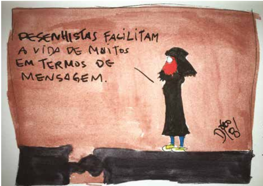
Desenhista e mensagem