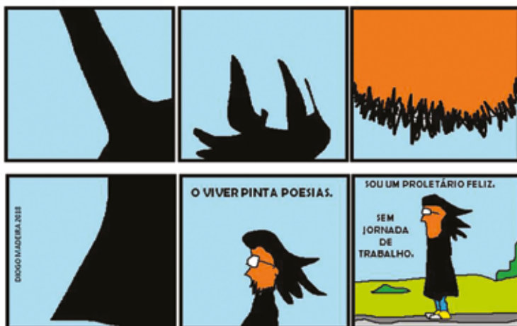
Proletário feliz, Tirinhas “Vagões poéticos”