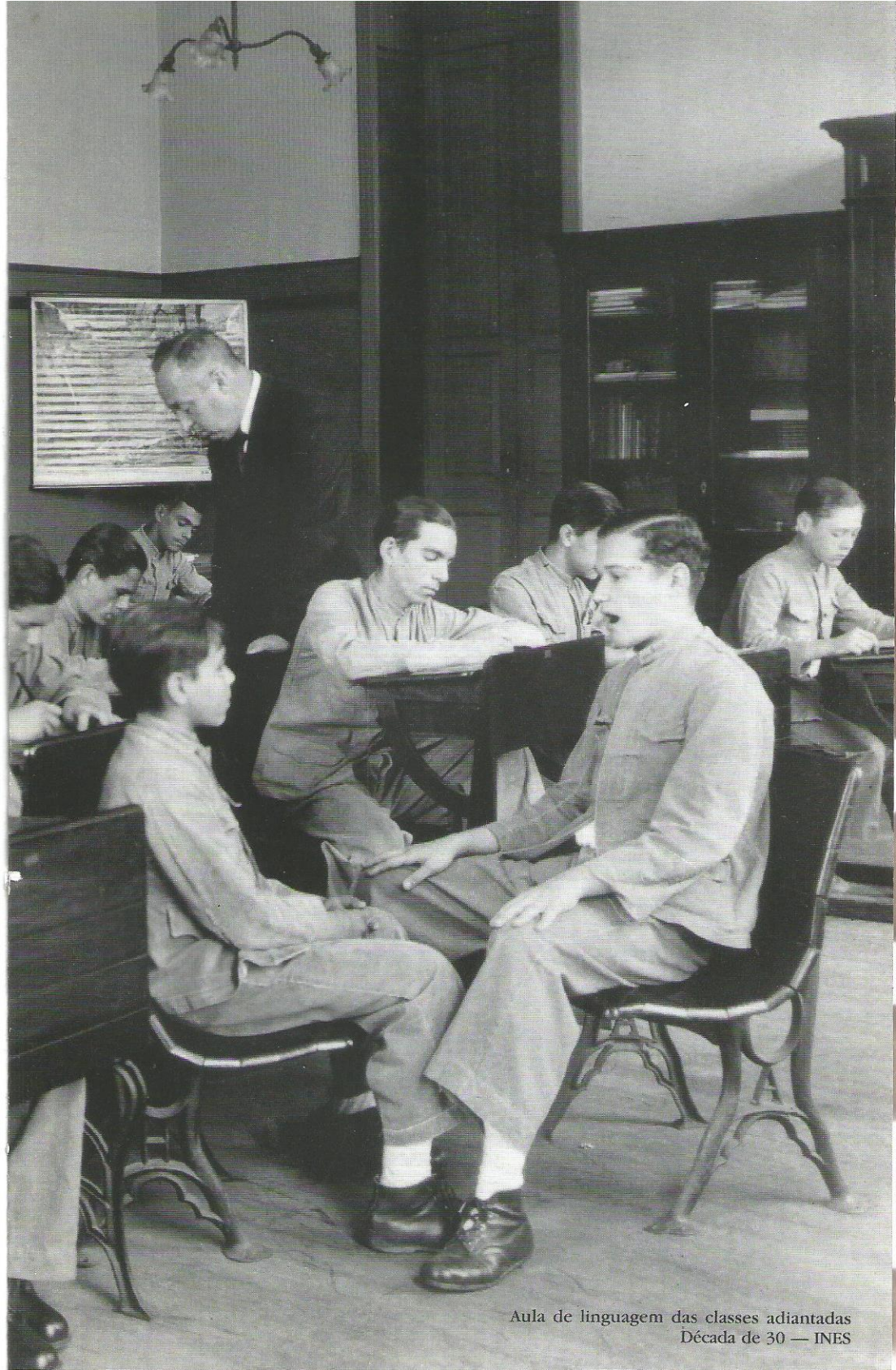
Aula de linguagem das classes adiantadas Década de 30 — INES