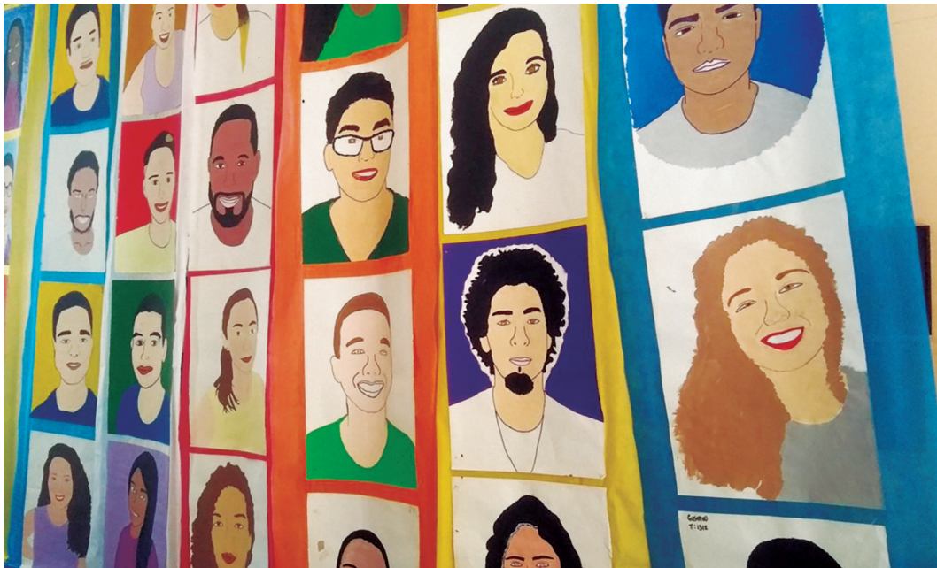
Projeto: "A cara do INES" (profs. Marcelino Rodrigues, Lucia Vignoli e Joana Lyra)