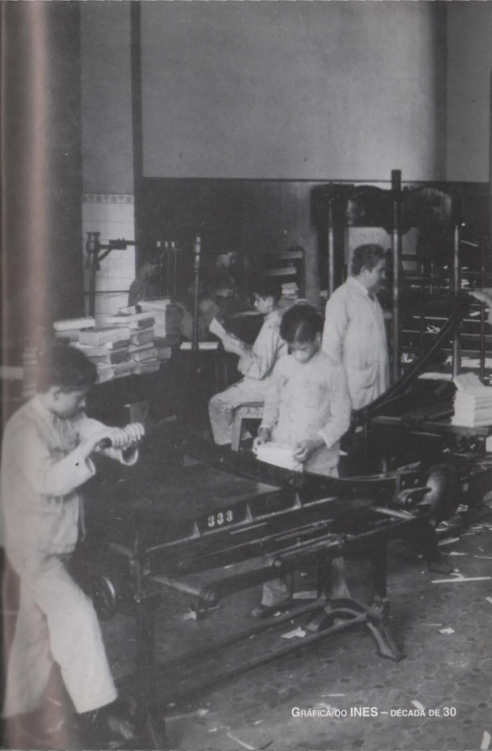
GRÁFICA DO INES — DÉCADA DE 30