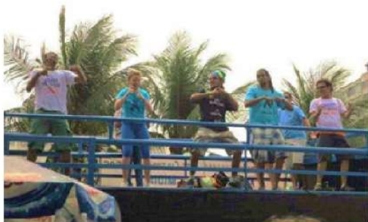
Figura 22 - Registro da 8ª Caminhada do Orgulho Surdo na Praia de Copacabana, Rio de Janeiro, 2011.