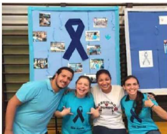
Figura 03 - Alunos e professores na feira do “Setembro Azul” na quadra CAP-INES.