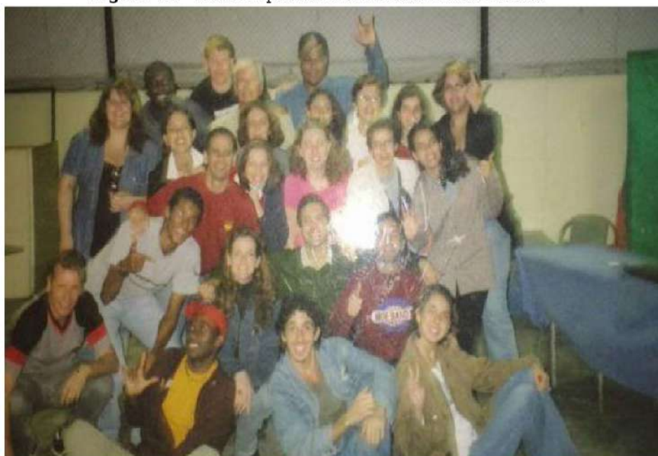
Figura 40 - Essa foi primeira turma de APADA-Niterói

Espaços formativos liderados por docentes Surdos são significativos para a difusão dos saberes da Cultura Surda. Muitos dos jovens Surdos na imagem a seguir, nessa época em formação, se tornaram pessoas muito significativas e articuladoras do processo de defesa dos direitos Surdos no Rio de Janeiro e fora dele.