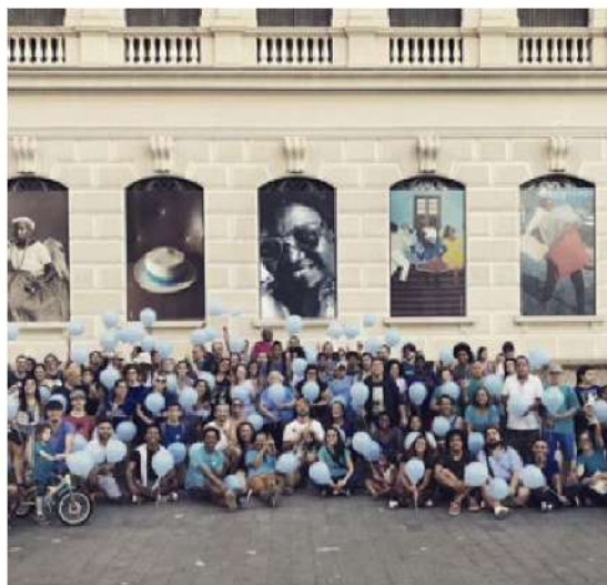
Figura 29 - Registro da 15ª Caminhada do Orgulho Surdo - Museu de Arte do Rio (MAR), 2018.