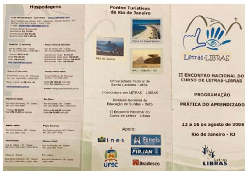
Figura 07 - Folder (verso): programação de II Encontro Nacional do Curso de Letras/LIBRAS do Rio de Janeiro

Algum ano antes do evento que descrevemos inicialmente nesse artigo, no mês de agosto de 2008, aconteceu o “2º encontro Nacional de estudantes de Letras-Libras”. Reconhecemos que uma das palestrantes que esteve presente nesse evento influenciou muito nossas noções a respeito dos conceitos de Movimento Social, Identidade e Cultura Surda.