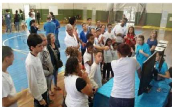
Figura 05 - Os professores organizadores da pesquisa e apresentação na feira.’