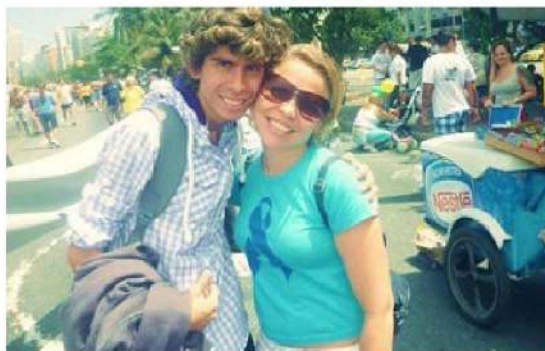
Figura 23 - Registro da 9ª Caminhada do Orgulho Surdo na Praia de Copacabana, Rio de Janeiro, 2012.