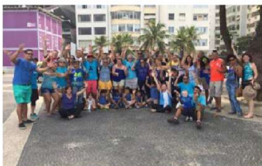
Figura 26 - Registro da 12ª Caminhada do Orgulho Surdo na Praia de Copacabana, Rio de Janeiro, 2015.