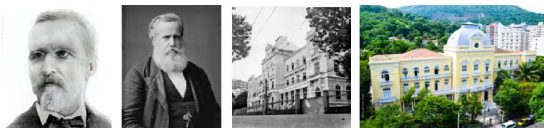
Figura 01 - Mosaico de imagens: E. Huet, Dom Pedro II, fachada do INES nos anos 60 e atualmente. Imagens do Memorial Institucional do INES. Última imagem do fotógrafo Surdo Renato Nunes.

A data escolhida para o evento foi 26 de setembro, quando já se comemora o Dia Nacional do Surdo. O mês de setembro, cabe lembrar, se tornou especial para as Comunidades Surdas em diversos lugares do Brasil e do Mundo ao longo dos anos. No Brasil a data foi escolhida em decorrência da fundação do INES, fundado pela parceria entre o professor Surdo francês Huet e o Imperador Pedro II na data de 26 de setembro de 1857.