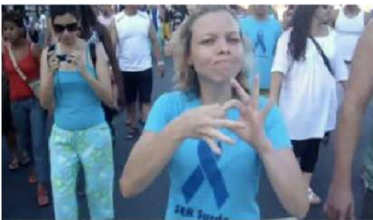
Figura 20 - Registro da 6ª Caminhada do Orgulho Surdo na Praia de Copacabana, Rio de Janeiro, 2009.