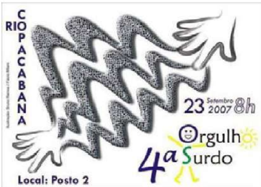
Figura 18 - Estampa da camiseta no ano 2007