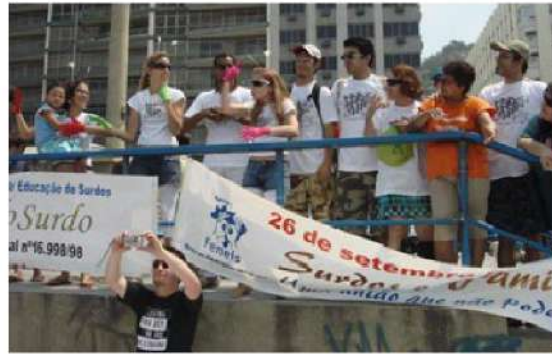
Figura 17 - Registro da 4ª Caminhada do Orgulho Surdo na Praia de Copacabana, Rio de Janeiro, 2007.