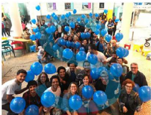
Figura 30 - 16ª Caminhada do Orgulho Surdo no Museu de Arte do Rio (MAR), 2019. Foto comemorativa formando a Letra "S" em referência ao Orgulho Surdo.