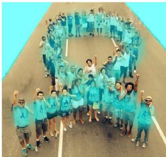
Figura 25 - Registro da 11ª Caminhada do Orgulho Surdo na Praia de Copacabana, Rio de Janeiro, 2014.