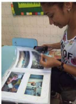
Figura 12 - Autora Surda em pesquisa-investigação para coleta de dados em registro, 2016.