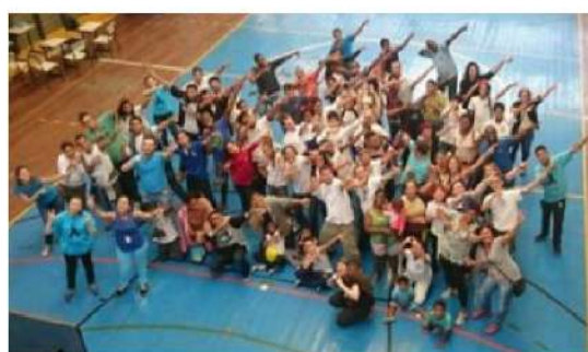
Figura 04 - Professores de Libras Surdos presentes na feira.