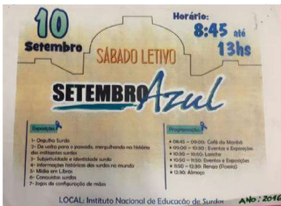
Figura 02 - Panfleto da Feira do Surdo no mês "Setembro Azul".