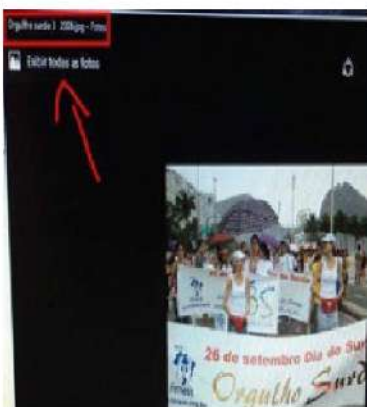
Figura 11 - Exemplos de registros nos arquivos gravados da 3ª Caminhada Orgulho Surdo, 2006.