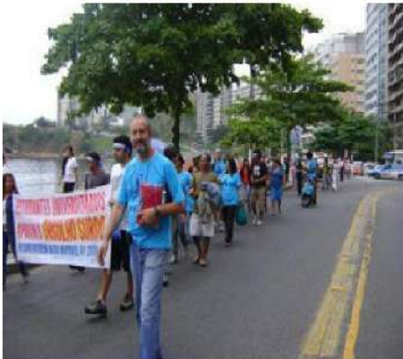
Figura 37 – Registro da Caminhada do Orgulho Surdo no bairro Icaraí, Niterói.