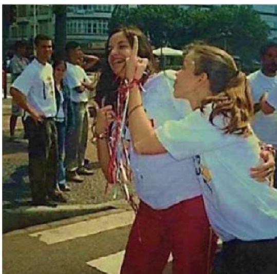
Figura 14 - Registro da 1ª Caminhada do Orgulho Surdo na Praia de Copacabana, Rio de Janeiro, 2004.