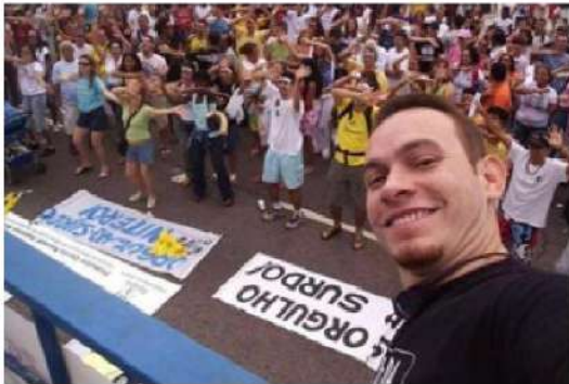
Figura 16 - Registro da 3ª Caminhada do Orgulho Surdo na Praia de Copacabana, Rio de Janeiro, 2006.