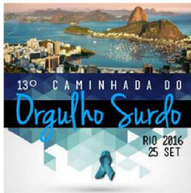
Figura 32 – Cartaz de chamada para a 13ª Caminhada em 2016.