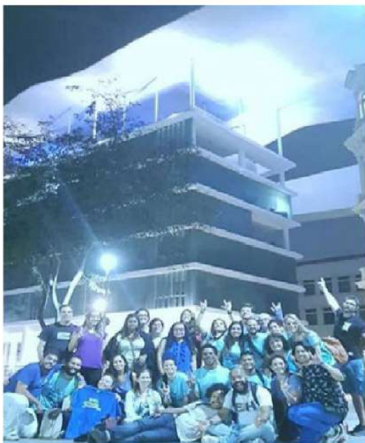
Figura 28 - Registro da 14ª Caminhada do Orgulho Surdo com iluminação em cor azul do teto do Museu de Arte do Rio (MAR), 2017.