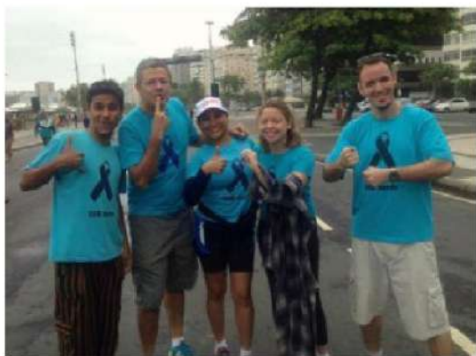
Figura 24 - Registro da 10ª Caminhada do Orgulho Surdo na Praia de Copacabana, Rio de Janeiro, 2013.