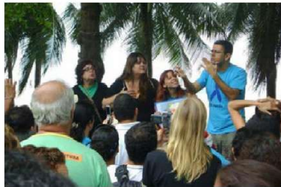
Figura 19 - Registro da 5ª Caminhada do Orgulho Surdo na Praia de Copacabana, Rio de Janeiro, 2008.